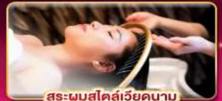
สระผมสไตล์เวียดนาม