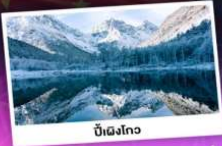
บี้ฝิงโกว

เทือกเขาแอลป์เมืองจีน "ภูเขาซีครุณี" ชมความสวยงามของอุทยานบี้ฝิงโกว